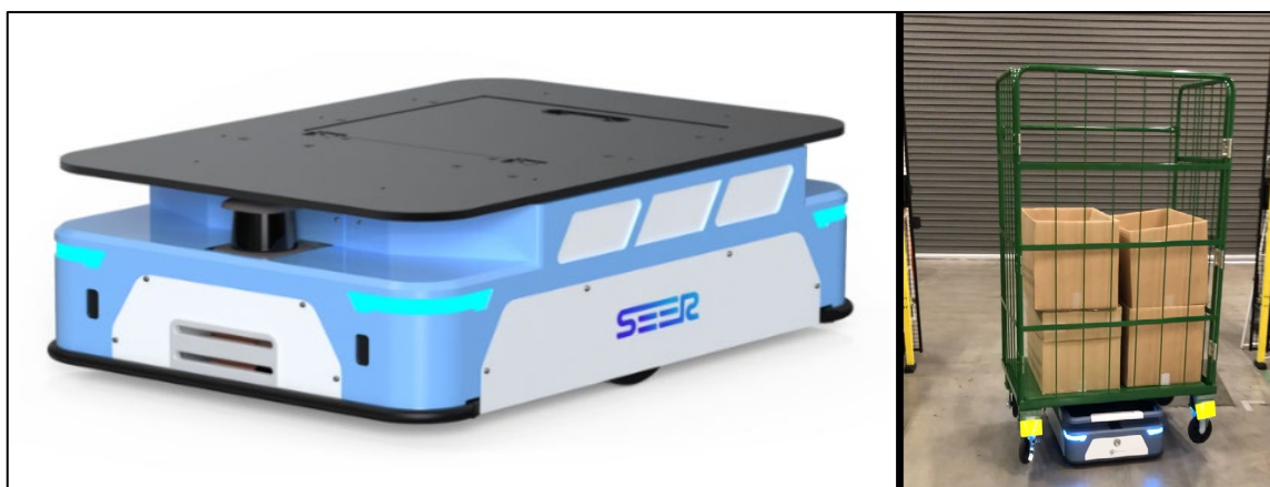
AMB-J：人と共存可能、無人で重量物からカゴ車まで搬送可能