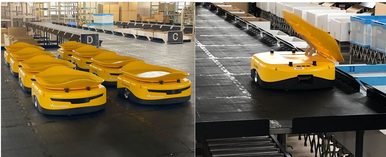
+AがRaaSで提供するソーティングロボットシステム「t-Sort」

松戸営業所はこれまで、少量多品種商品を中心に様々な荷主へ物流サービスを提供しながら、業務プロセス改善やテクノロジー等を活用した効率的なロケーション運営、作業の可視化による荷役作業の効率化等、物流サービスの高度化に取り組んできました。今回、+Aのt-Sortを活用したRaaSは、アパレル商品の出荷業務のみならず、シーズン入替時返品等の一時的な大量仕分け作業等においても圧倒的な効果を発揮します。澁澤倉庫と+Aは今後も協業を継続し先進テクノロジーとそれを活用する現場力の融合を更に推し進め、他拠点への展開並びにさらなる物流の高度化を共に目指します。